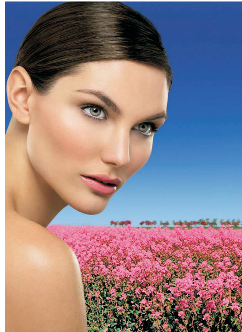
Специфична успокояваща, защитна процедура, предназначена за най-чувствителната, деликатна, дехидратирана и изтощена кожа